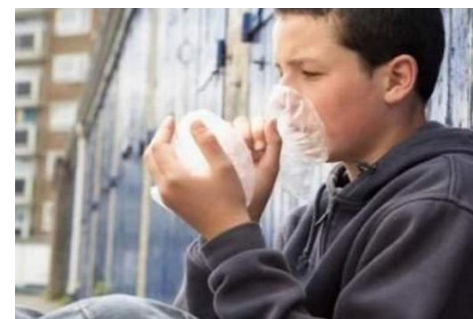
«Родителям о наркомании, токсикомании»